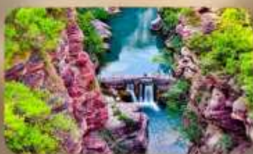
อุทยานหยุ่นโตซาน