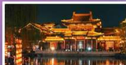
เมืองโบราณลั่วयी